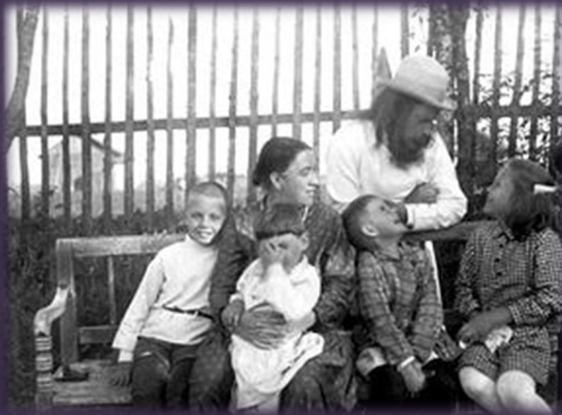
Праведный отец Алексей Мечев с семьей