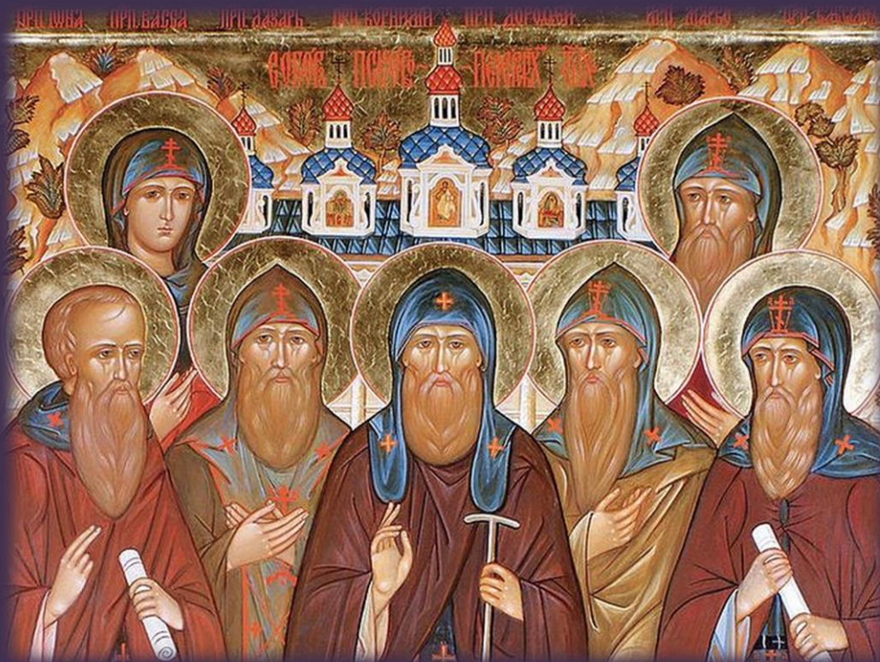
Преподобные Иона и Васса Псково-Печерские