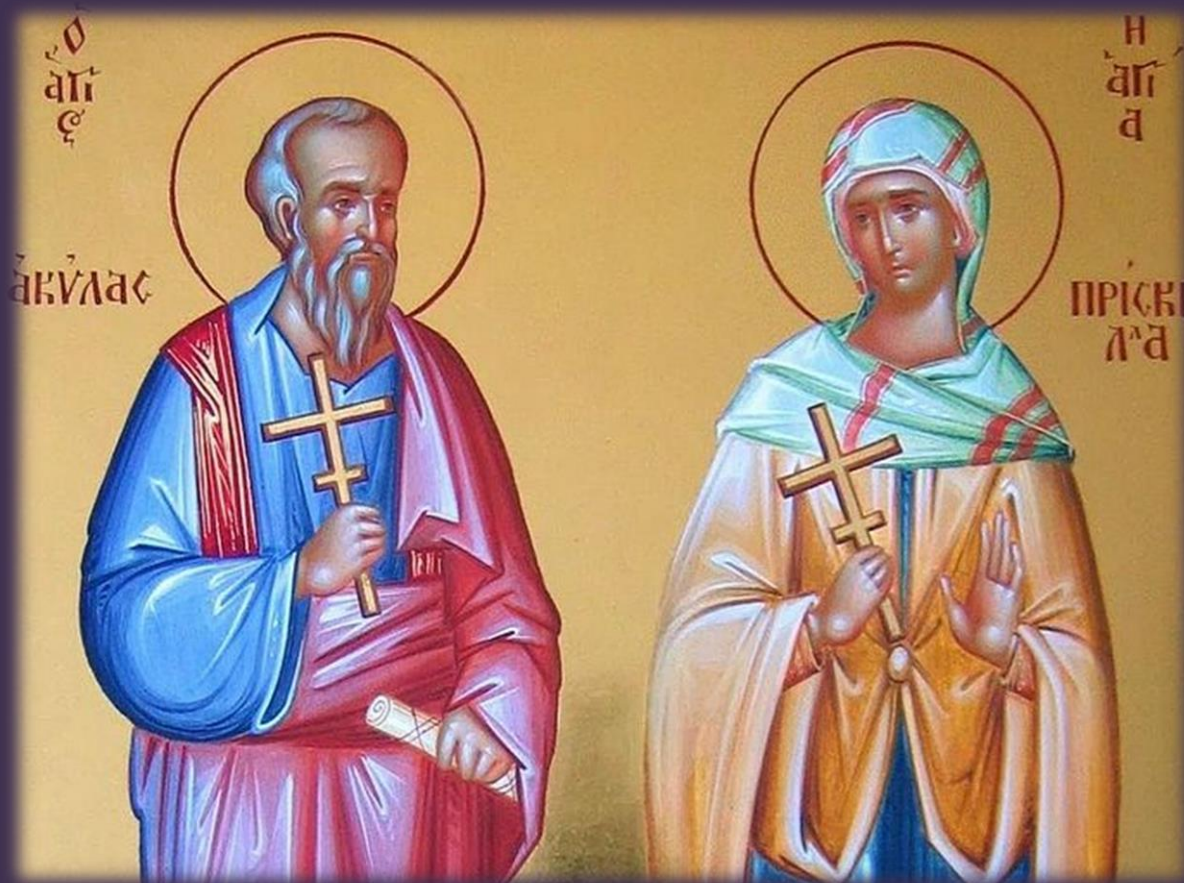
Апостол Акила и его жена Прискилла

Древние времена изобилуют примерами мученичества христиан, поэтому неудивительно, что одни из первых прославленных супругов были мучениками. Это апостол Акила – епископ Гераклеяский, ученик апостола Павла – и его жена Прискилла, вместе проповедовавшие в Азии, Ахайе, Ираклии и убитые язычниками. Это мученики Зоя и Еспер, бывшие рабами и замученные за свою веру вместе с сыновьями Кириаком и Феодулом во времена гонения императора Адриана во II веке. Это святые мученики Терентий и Неонилла Сирийские и их семеро детей: они жили в III веке и были истязаемы и в конце концов обезглавлены за безбоязненное исповедание Христа.