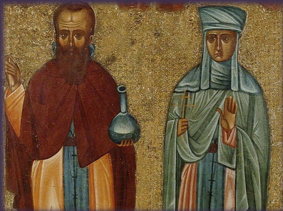
Андроник и Афанасия

Интересно, что чем-то похожую историю мы находим в древности – в судьбе ремесленника Андроника и его жены Афанасии, живших в V веке в Антиохии. Заработанные своим трудом деньги супруги делили на три части: одну отдавали в церковь, другую – бедным, третью оставляли себе. Рубежом их жизни стала смерть обоих их детей. Пережив это горе, муж и жена решили целиком посвятить себя служению Богу и ближним и через некоторое время отправились в Александрию, чтобы разойтись по монастырям: Андроник ушел в скит, а Афанасия – в женский Тавеннисиотский монастырь.