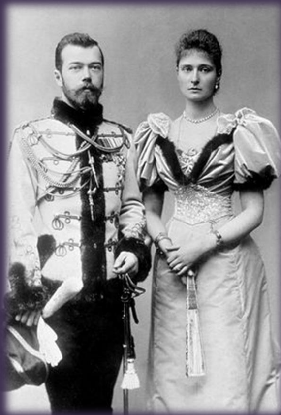
Царь Николай и царица Александра

Все искусства в мире воспевают влюбленность, страсть, но мало кому удастся пронести нежные, полные любви отношения через всю жизнь. Последний российский император и его супруга стали таким редким примером. Читая их переписку 1894 года, мы не удивляемся обилию нежных слов: они – жених и невеста, находящиеся в разлуке и в напряженной ситуации, когда их брак мог и не состояться, ведь против него изначально был император Александр III. Но вот они – муж и жена уже на протяжении 20 лет, у них пятеро детей, и письма этого периода – письма зрелой любви – вызывают удивление и восхищение.